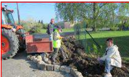
La Présidente et les 2 employés communaux en pleine action.

La belle saison est de retour !L'embellissement du village (priorité de l'Association« Fleurissons Novion » )est commencé : plantations de nouveaux massifs et haies, prévus en assemblée générale.