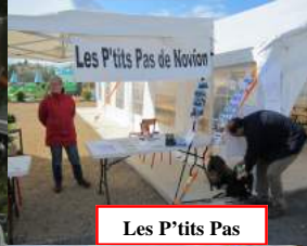
Les P'tits Pas