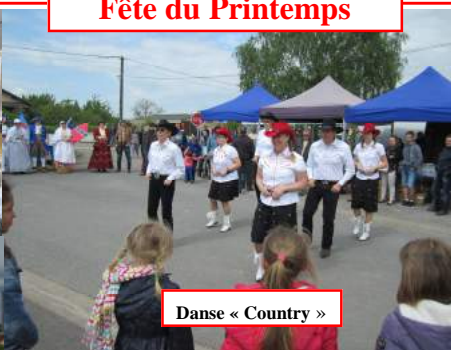
Danse « Country »