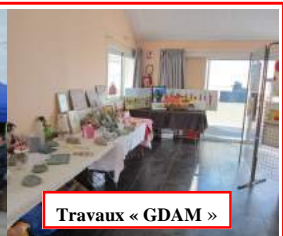
Travaux « GDAM »