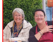
Hôtesse de Caisse