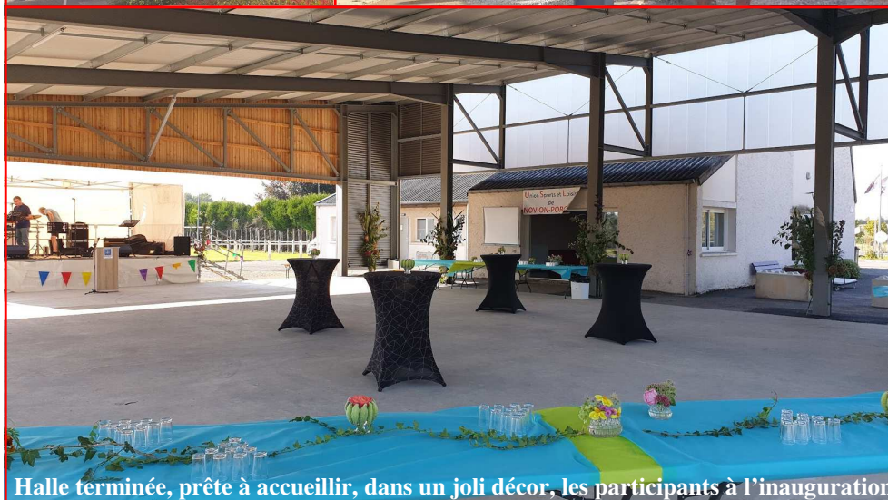
Halle terminée, prête à accueillir, dans un joli décor, les participants à l'inauguration