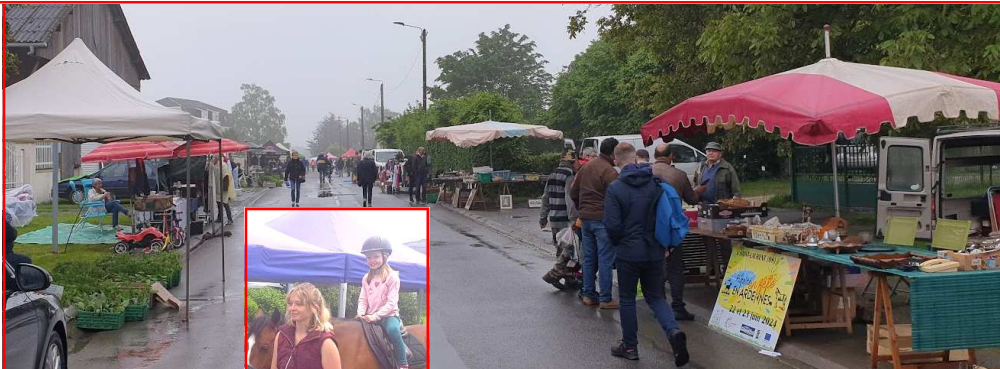
Ballade à Poney

Débutée avec la pluie, annulant la moitié des exposants, la journée s'est malgré tout, bien déroulée. Un public nombreux a circulé dans les rues ensoleillées l'après midi, pour la grande satisfaction des exposants courageux et des bénévoles de l'association qui ont vu leurs efforts, en partie, récompensés.