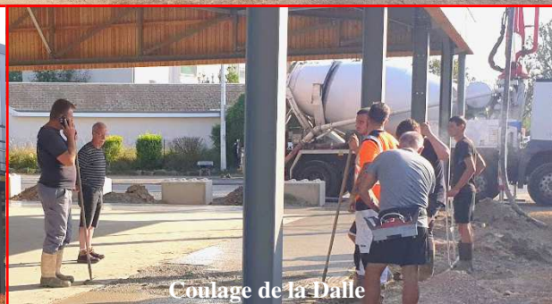
Coulage de la Dalle