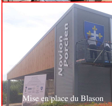
Mise en place du Blason