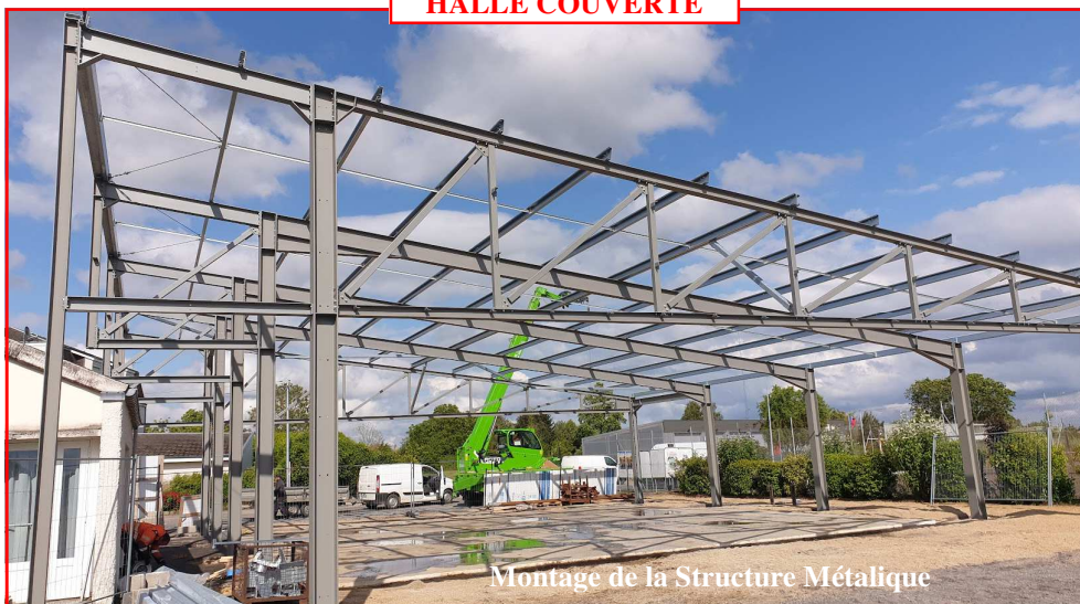
Montage de la Structure Métallique